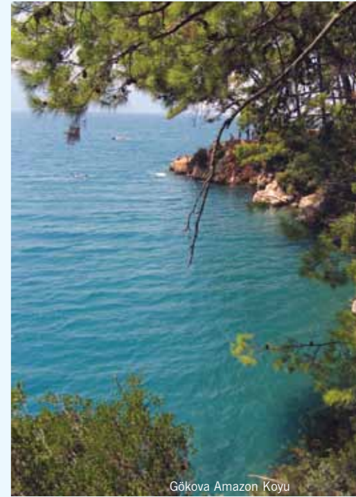
Gökova Amazon Koyu

Bir plajda, akşamüstüne doğru, şezlong ve şemsiyelerin arasında dolaşan yaban domuzu sürüsüne rastlamak kulağa pek hoş gelmiyor olabilir ancak Dilek Yarımadası Milli Parkı'nın müdavimleri için bu sıradan bir durum ve paniğe gerek yok. Güzelçamlı sınırları içindeki Dilek Yarımadası Milli Parkı Kuşadası'na 28 km uzaklıkta yer alıyor. Araçla girilebilen milli parkta, 10 km'lik dar yerleşim alanı yaklaşık 100 km'lik bir orman örtüsü ile çevrili. Zengin bitki örtüsü, yaban hayatı, mağaraları ve vadileriyle, bozulmamış bu doğal alanın 30 km'lik kıyı şeridinde güzel plajları var. Buralara kadar gitmişken tabi Efes, Didim, Priene, Bafa Gölü, Herakleia, Afrodiasias, Pamukkale ve Hierapolis'i görmek gerek. Zeus Mağarası'nın mavi, yeşil suyunda yüzmek de ayrı bir keyif. Parkın karadan ulaşılamayan koylarını görmek